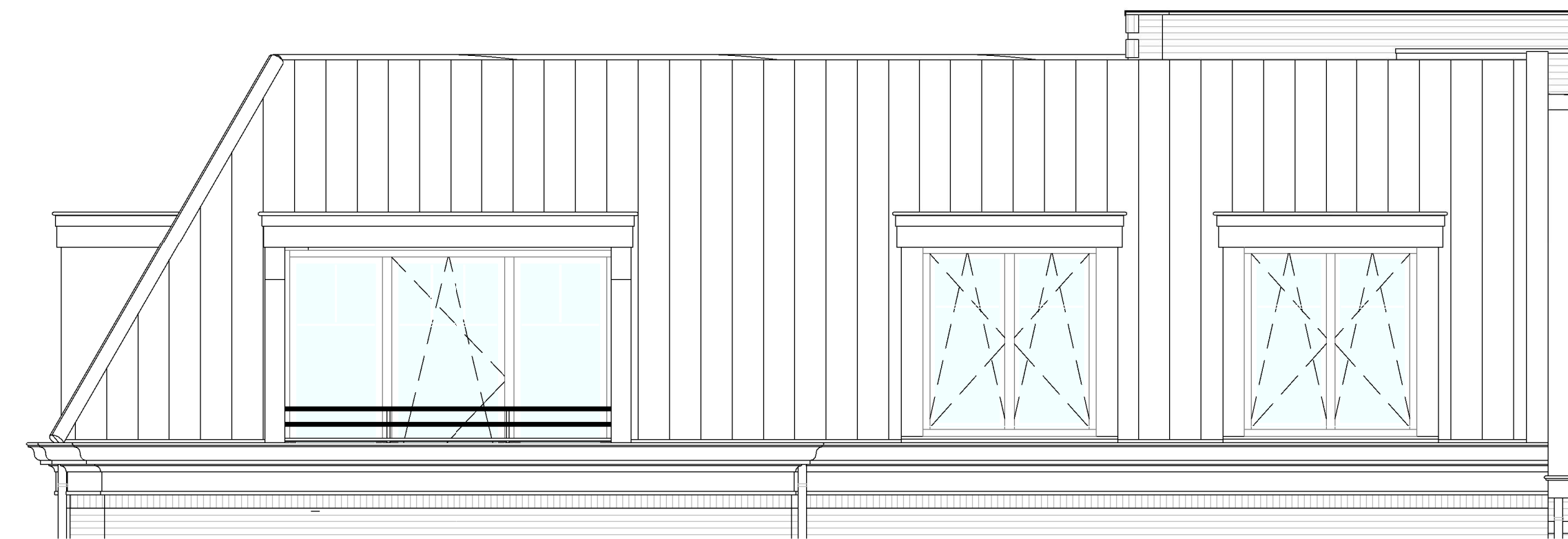
Rechter zijgevel bouwnummer 70