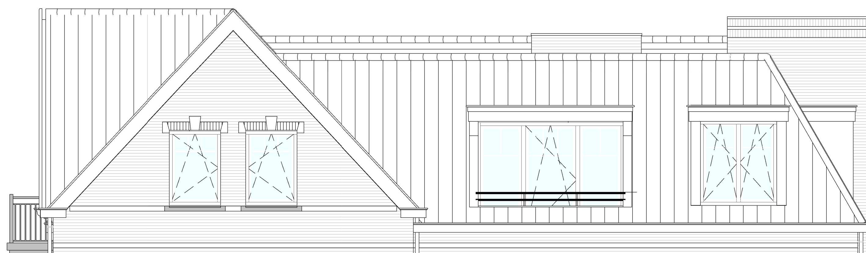
Voorgevel bouwnummer 70